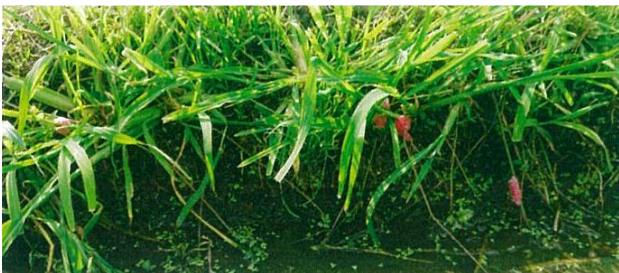
写真 畦畔に産卵された卵塊（千葉県内 圃場）

スクミリンゴガイによる被害は水稻移植栽培だけでなく湛水直播栽培でも大きいとされています。もともと九州で被害が多くみられていましたが、最近では関東まで被害がクローズアップされ、その被害は25府県に拡大し、被害面積は10万haに及ぶといわれています（平成24年調査）。