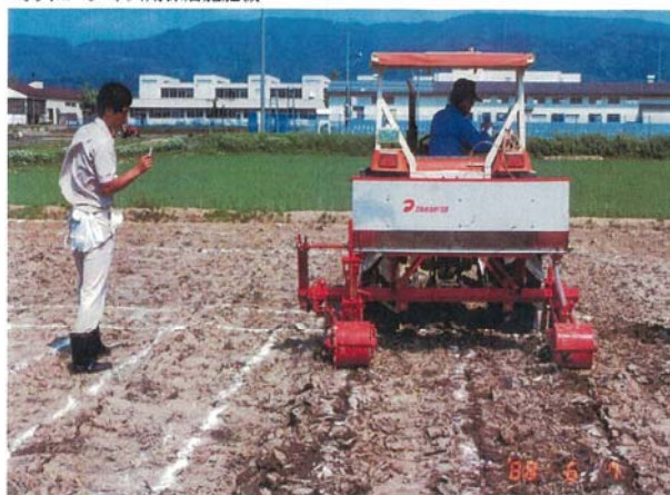
写真1 ダイズ用深層施肥機

根粒菌の接種方法で収量を比較すると、おおむね非接種PP区<箱苗区<接種PP区の順であった。